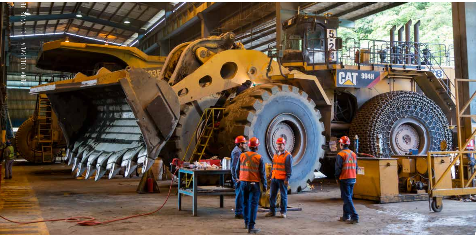
Trabajo en equipo en el Taller de “La Encantada”, donde se da mantenimiento a equipo móvil de Peña Colorada.

Tras conocer a detalle el programa de Equipos de Mejora , Roberto Barbosa consideró fundamental que Peña Colorada “continúe en este mismo tenor, porque ahí están los resultados, ya se están viendo no solamente en la empresa, también a nivel nacional” . ●