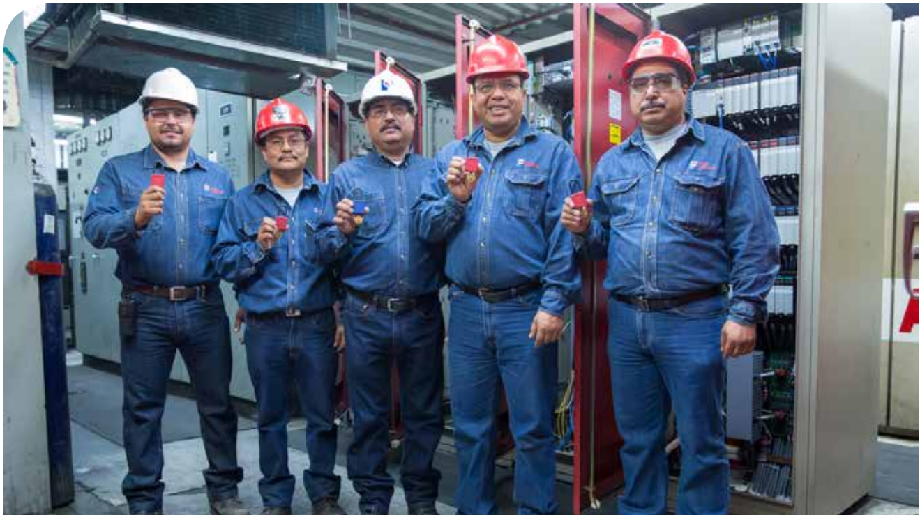
El equipo “ Tecnoeléctricos ” trabajó para modernizar un proceso de seguridad muy importante.